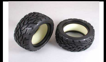
53854 UVP 19,45 Blockreifen V-Profil