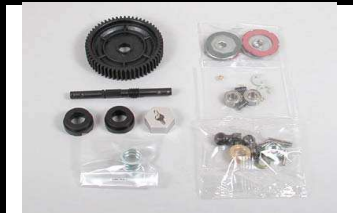
53855 UVP 69,- Slipper-kupplungsset