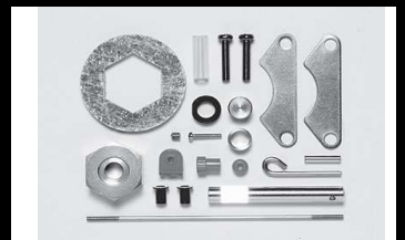
53801 UVP 20,- Doppelbremsscheibenset