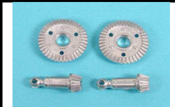
53852 UVP 13,75 Kegel/Tellerr.14/39Z