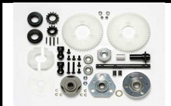
53780 UVP 85,- 2 Gang-Getriebe