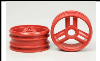
51162 UVP 7,80 3-Speichen Felgen