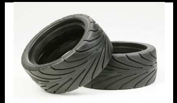
51193 UVP 13,30 NDF 01 Tamarc Reifen (2)