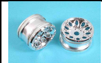
53853 UVP 14,40 NDF 01 R-Truck Felgen