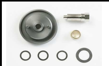
53822 UVP 19,50 Schwungrad Aluminium