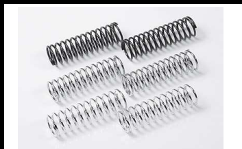
53778 UVP 9,30 Off-Road Federn-Set