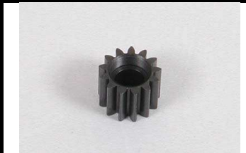
53820 UVP 7,70 Kupplungszahnr.13Z.