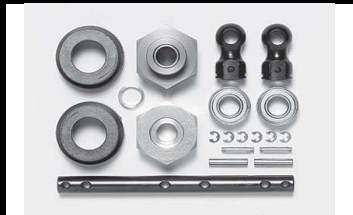
53802 UVP 42,50 verstärkte Antriebswellen