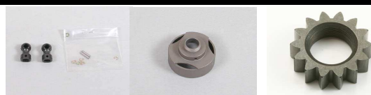
53816 Hauptzahnrad 13Z.NDF-01 53817 Hauptzahnrad 14Z.NDF-01 53818 Hauptzahnrad 15Z.NDF-01 53819 NDF 01 Kupplungszahnr.12Z.