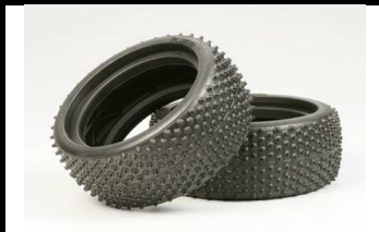
51163 UVP 12,20 PIN-Reifen NDF 01