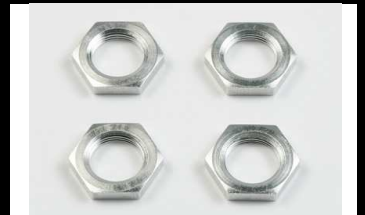
53821 UVP 6,80 Radmutter ALU 12 mm (4)